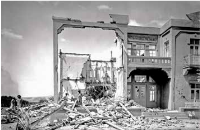
מנזקי הרעש במלון ביריחו

נזק משמעותי נגרם לבניין הדואר ביפו. תושבים דיווחו כי בשעת הרעש נמל יפו היה סוער מאוד אך הוא לא נפגע. לעיריית תל אביב הגיעו דיווחים רבים על הרס, ומהנדס העירייה מצא נזקים של ממש בבניינים מספר, כמו בבית לבונטין ברחוב יהודה הלוי, בבית איז'מוז'יק ברחוב פיירברג ובגן ילדים הסמוך ל"גימנסיה הרצליה".