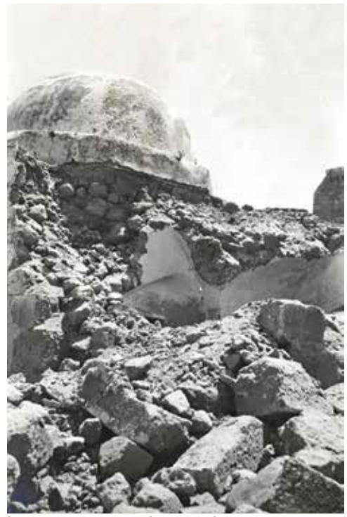
מימין: מנזקי הרעש בלוד, משמאל: מנזקי הרעש בשכם