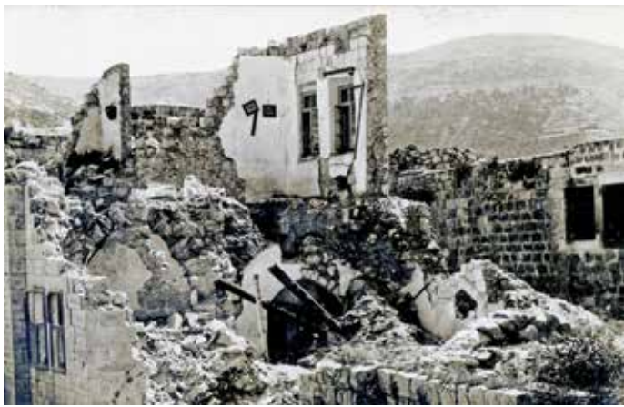
בתים הרוסים בשכם לאחר רעידת האדמה, 16.7.1927