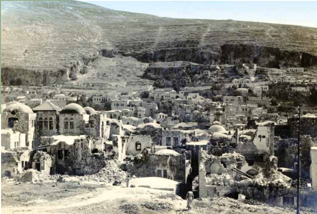
שכבם לאחר רעידת האדמה, 16.7.1927