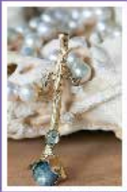
ממירק שלם | ורדה חתם