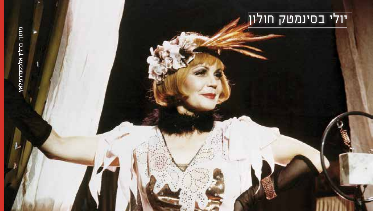
מתוך: ברלין אלכסנדרפלאץ

מדיטק, רח' טלדה מאיר 6, חולון. מניה חיים.