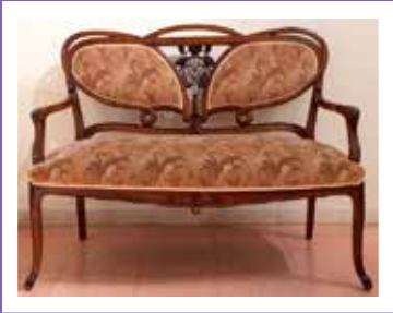
דימוי: צייר לי כסא, גלריית החווה - מתוך אוסף מי-דן