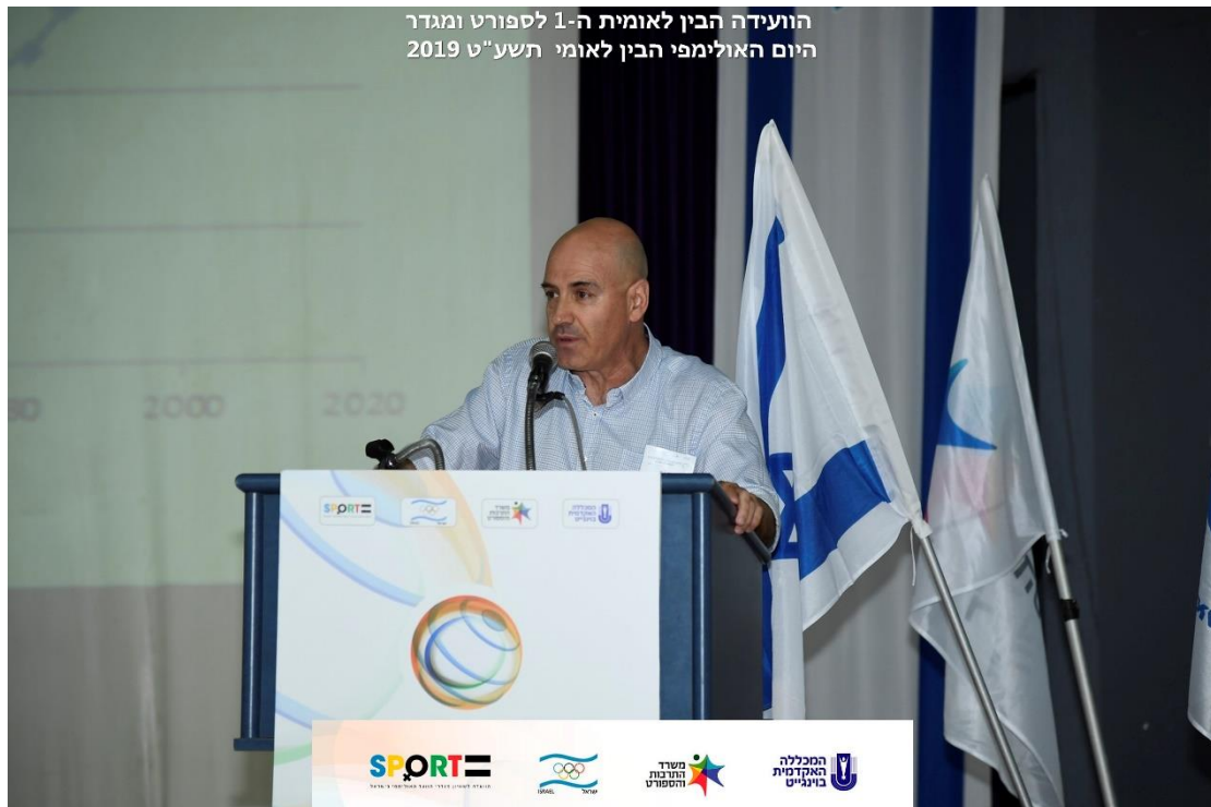
הוועידה הבין לאומית ה-1 לספורט ומגדר היום האולימפי הבין לאומי תשע"ט 2019

עולם הספורט והתנועה האולימפית במרכזו הם שיקוף של מגמה זו. אם במשחקים האולימפיים הראשונים בעידן המודרני לא השתתפו נשים כלל, הרי שהתחזית לקראת משחקי טוקיו קרובה מאוד ל-50% של משתתפות.