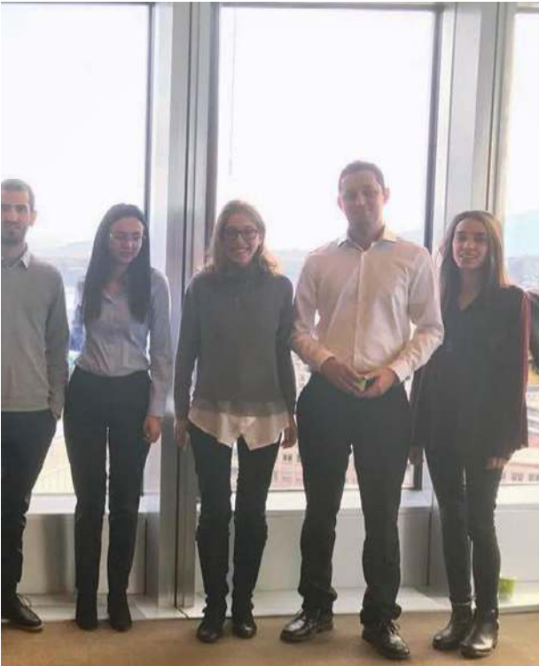
משלחת הסטודנטים לכנס הלימוד העשתי של WIPO