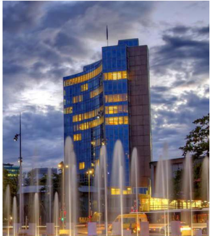
מטה WIPO בז'נבה