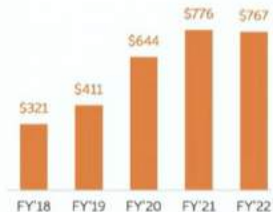
Total Revenue ($ in millions)