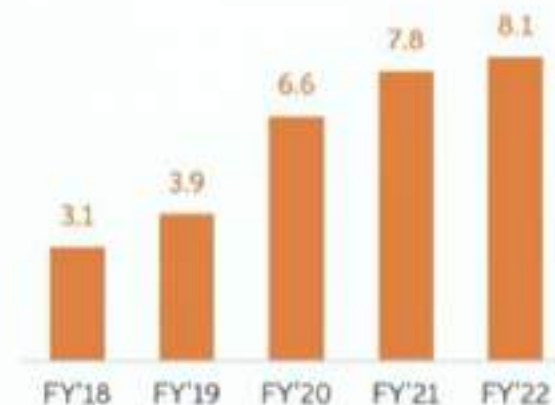
Subscription Services Subscribers ( millions)