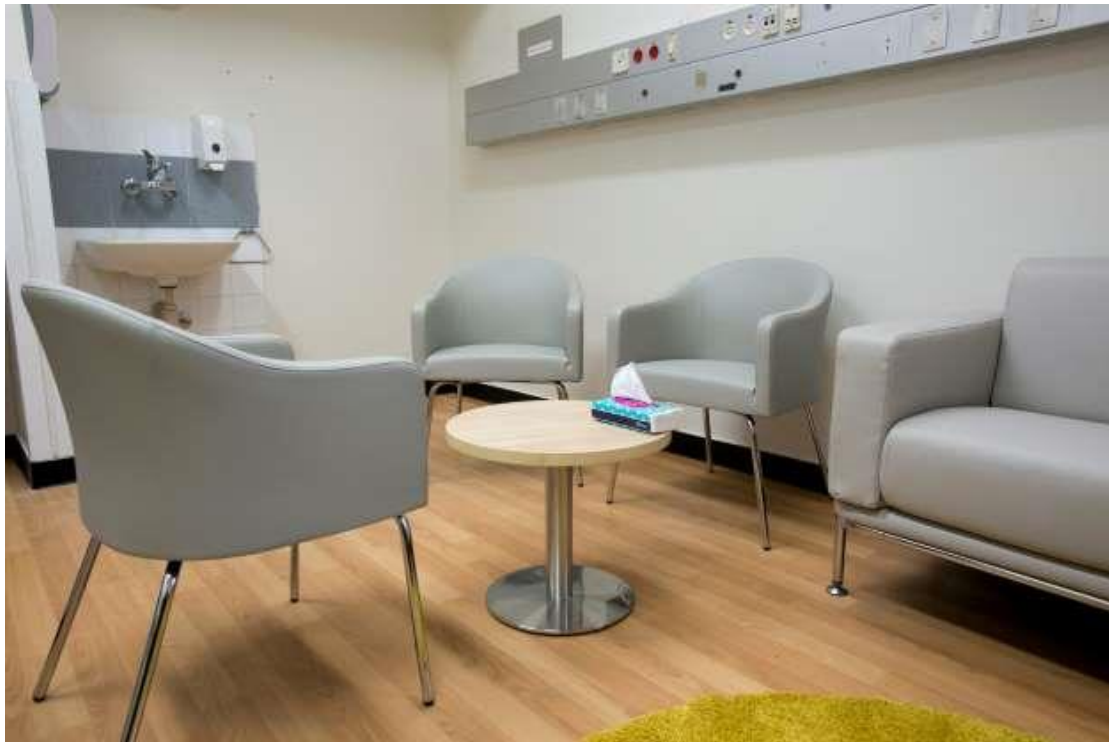
המחלקה הפסיכיאטרית בבית החולים איכילוב, ב-2016

עוד נמצא כי שיעור גבוה מקרב שלוש הקבוצות של אנשי המקצוע העריכו כי לאחר הרפורמה חלה עלייה בעיסוק בבירוקרטיה (84%, 73% ו-70% בקרב העובדים הסוציאליים, הפסיכולוגים והפסיכיאטרים, בהתאמה), בפיקוח על אבחנות ותוכניות טיפול ובהתערבות בשיקול הדעת של המטפלים מצד גורמים במקביל, חלה ירידה בזמן המוקדש להתייעצויות וישיבות צוות. 55% מהפסיכולוגים. שאינם טיפוליים שעיקר עבודתם במגזר הציבורי דיווחו כי איכות הטיפול הניתן לאחר הרפורמה נמוכה יותר.