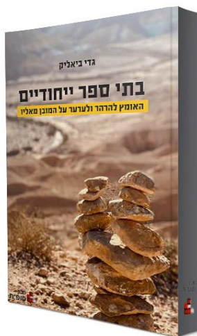
בתי ספר ייחודיים: האומץ להרהר ולערוך על המובן סאלני