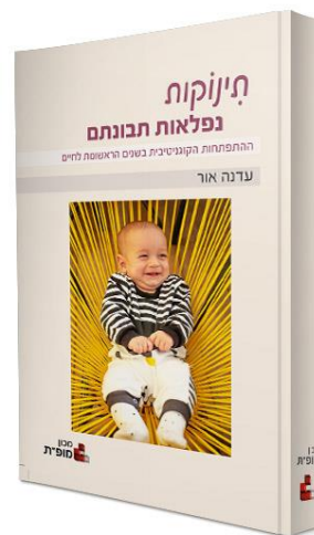
הינזקות נפלאות תבונתם: ההתפתחות הקוגניטיבית בשנים הראשונות לחיים