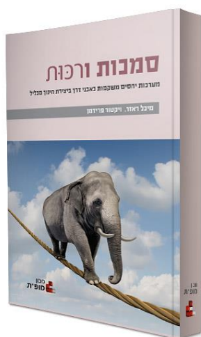
סמכות ורכות: מערכות יחסים משקמות כאבני דרך ביצירת חינוך מכליל

מטרת הסדנה להכשיר את אוכלוסיית היעד להדרכת NLP בקבוצות, לרבות הסמכת מנחים בשיטה, העברת תהליכים לקבוצות, שימוש בכלי NLP בהנחיית קבוצות מכל סוג. היקף: 120 שעות אקדמיות למידע נוסף ולרישום