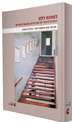
לפתוח דלת: יוזמות לאחריות חברתית בהכשרת מורים