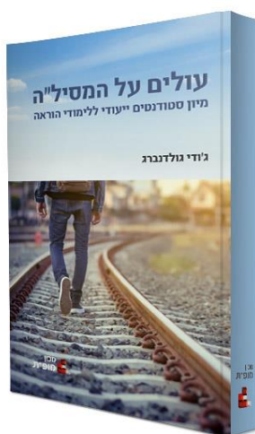
עולים על המסילה: מיון סטודנטים ייעודי ללימודי הוראה