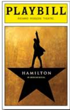
פלייביל מההפקה המקורית בברודווי מתוך ויקיפדיה

אם זה לא עולה הרבה, למה לא בעצם? זה מזכיר לי בהרבה מובנים את כיתה ז' קורסים במדע וטכנולוגיה וכאלה... דווקא צילום. ומהמצב המוזר שבו צילום למשהו חדש לחלוטין, רק כי זה מה ש'זרם'. חזרה להפקה. התחלנו לעשות חזרות, יכולים לעשות הכל, די מהר הבנו שאין לנו של אלעד מוגבל להשתתפות מוגבלת