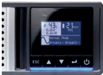
Écran LCD intuitif pour faciliter la configuration et la gestion